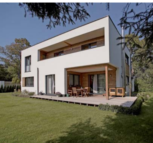
GriffnerHaus AG, box