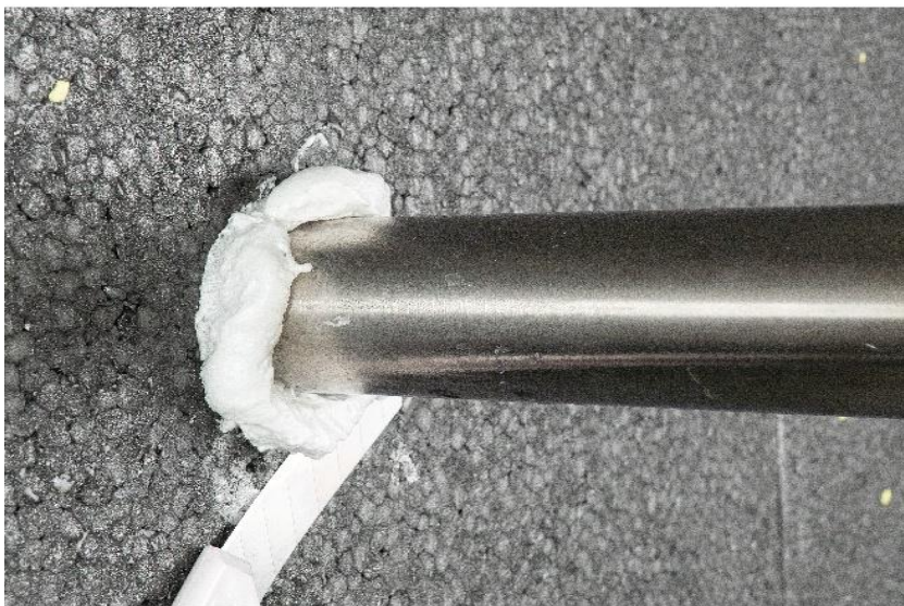
Abb. 3: Nach dem Aushärten überstehenden Schaum entfernen