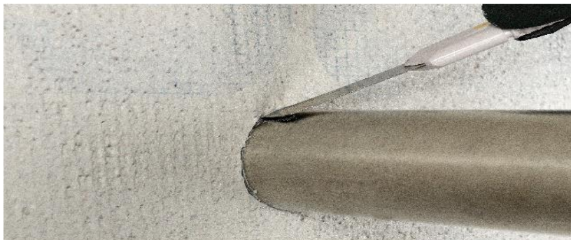
Abb. 4: Unterputz / Oberputz vom Bauteil mittels Kellenschnitt trennen

Sto Ges.m.b.H. Richtstraße 47 A - 9500 Villach Telefon: 04242 33-1330 Telefax: 04242 34-347 www.sto.at