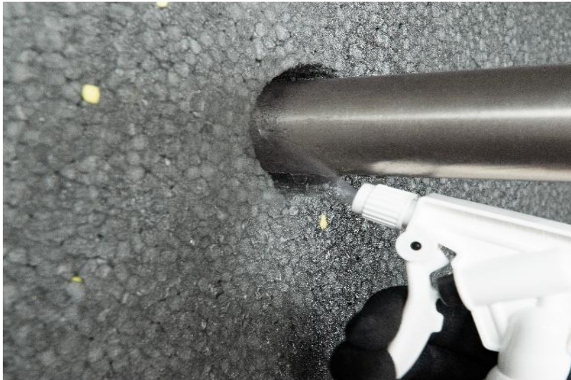
Abb. 1: Fuge mit Wassersprüher befeuchten