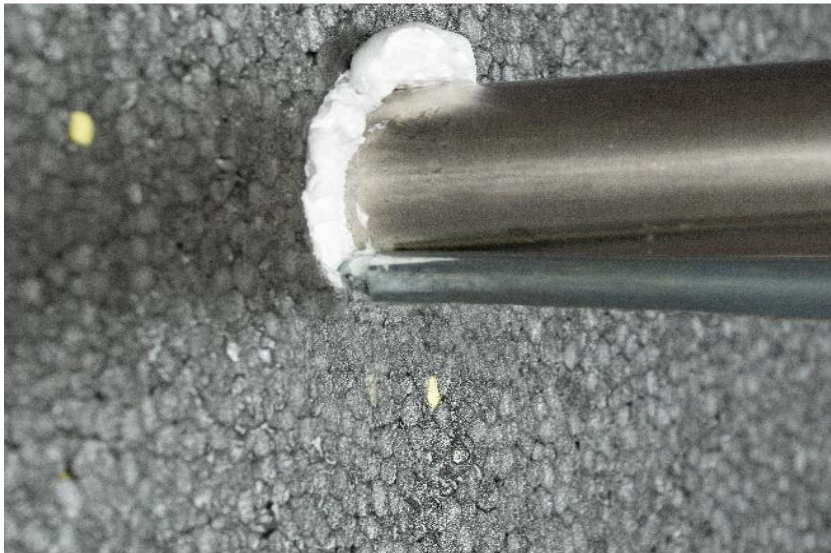
Abb. 2: Schaum in die Fuge einbringen