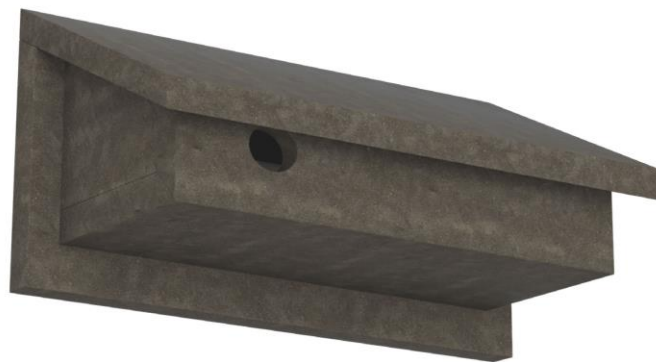
Abbildung 1: Ansicht StoElement Fauna SP-F 20